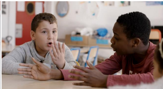
Un film dramatique. Éric Baudelaire, 2019.

Sala Z, desde el 25 de noviembre de 2021 hasta el 23 de enero de 2022