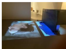
6.- Régimen diurno (Alisa) , 2020 Proiektzioa eta altzairuzko xafla Proyección y chapa acero Screening and steel sheet