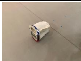
1. Orlando , 2020 Erretxin akrilikoa, ehuna, eskaiola eta zeramika Resina acrílica, textil, escayola y cerámica Acrylic resin, textile, plaster and ceramic 44 x 36 x 50cm