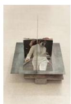
14.- Régimen diurno (Elaine) , 2015 Burdinezko xafla eta NOVA aldizkaria, 1968ko azaroa Chapa de hierro y revista NOVA, nov. 68 Iron plate and NOVA magazine, Nov. 68 61 x 61 x 61 cm