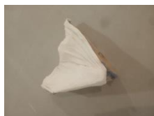
3.- ST (Voy, sí) , 2020 Hormigoia, pigmentuak altzairua, argizaria, ehunak Hormigón, pigmentos, acero, cera, textil Concrete, pigments, steel, wax, textile 71 x 115 x 110 cm