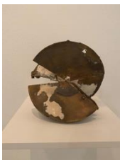
22.- Instrumentos y fetiches , 2017-2018 Brontzea, zeramika estaldura Bronze, revestimiento cerámico Bronze, ceramic coating 24 x 25 x 16 cm Bilduma pribatua Colección particular Private collection