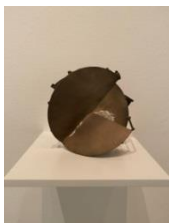
20.- Instrumentos y fetiches , 2017-2018 Brontzea, zeramika estaldura Bronze, revestimiento cerámico Bronze, ceramic coating 22 x 26,5 x 16,3 cm Bilduma pribatua Colección particular Private collection