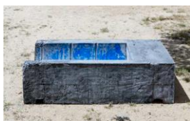
12.- Core , 2019 Hormigoi armatua, pigmentuak eta margoia Hormigón armado, pigmentos y pintura Reinforce concrete pigments and paint 40 x 135 x 86 cm