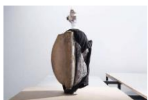
24.- Ser dos (2) , 2017 Brontzea, estaldura eta ehuna Bronze, revestimiento y textil. Bronze, coating and textile 35 x 35 x 20 cm Bilduma pribatua, Madril Colección privada, Madrid Private collection, Madrid