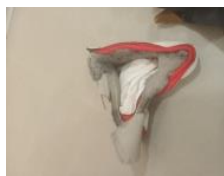
5.- ST (Voy, sí) , 2020 Hormigoia, porlana, altzairua, ehunak Hormigón, cemento, acero, textil Concrete, cement, steel, textile 37 x 75 x 71 cm