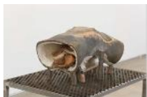
18.- Helmets III , 2019 Brontzea, zeramika estaldura, ehuna Bronze, revestimiento cerámico, textil Bronze, ceramic coating, textile 130 X 78 X 55 cm AZ Collection, Bilbo