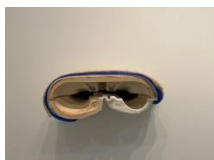
17.- No Osso (occipital) , 2020 Erretxin akrilikoa, eskaiola, ehuna Resina acrílica, vendas de escayola, textil Acrylic resin, plaster bandages, textile 130 x 58 x 45 cm