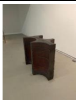
11.- Core , 2020 Hormigoi armatua, pigmentuak eta margoia Hormigón armado, pigmentos y pintura Reinforce concrete pigments and paint 102,5 x 71,5 x 114,5 cm