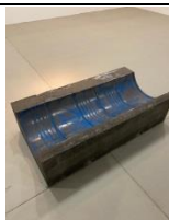
8.- Core , 2020 Hormigoi armatua, pigmentuak eta margoia Hormigón armado, pigmentos y pintura Reinforce concrete pigments and paint 40 x 82 x 155 cm