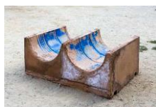
23.- Core , 2019 Hormigoi armatua, pigmentuak eta margoia Hormigón armado, pigmentos y pintura Reinforce concrete pigments and paint 55 x 140 x 93 cm