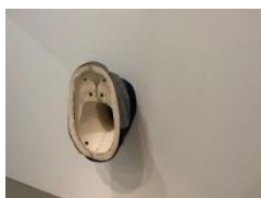
7.- No Osso (occipital) , 2020 Erretxin akrilikoa, hesgailuak, eskaiola eta ehuna Resina acrílica, vendas escayola y textil Acrylic resin, bandages, plaster and textile 47 x 120 x 52 cm