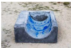
13.- Core , 2019 Hormigoi armatua, pigmentuak eta margoia Hormigón armado, pigmentos y pintura Reinforce concrete pigments and paint 40 x 100 x 96 cm