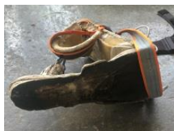
2. ST (Voy, sí) , 2020 Hormigoia, altzairua, argizaria eta ehuna hormigón, acero, cera y textil Concrete, steel, beeswax and harness 53 x 90 x 82 cm