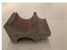
16.- Core , 2020 Hormigoi armatua, pigmentuak eta margoia Hormigón armado, pigmentos y pintura Reinforce concrete pigments and paint 71,5 x 78 x 120 cm