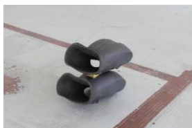
4.- Nao , 2018 Zeramika eta belakia Cerámica y esponja ceramic and sponge 43 x 85 x 38 cm