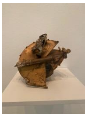
21.- Instrumentos y fetiches , 2017-2018 Brontzea, zeramika estaldura Bronze, revestimiento cerámico Bronze, ceramic coating 25 x 25 x 25 cm Bilduma pribatua Colección particular Private collection