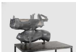
9.- Helmets I , 2019 Aluminioa Aluminio Aluminium 135 x 57 x 96 cm Bilduma pribatua Colección privada Private collection