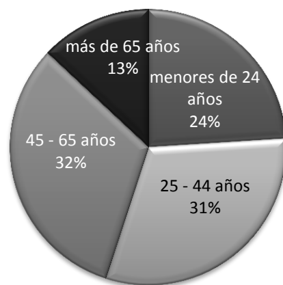
Edad de las y los visitantes 2019