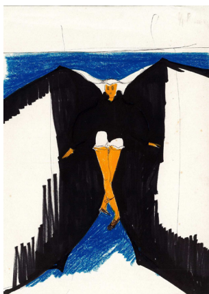
Juncal Ballestín, dibujos para vestuario teatral