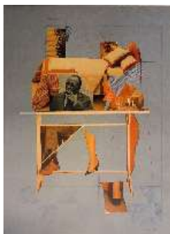
Collage (...and politics) , 1980

Collagea, gouachea eta harea kartoi mehean Collage, gouache y arena sobre cartulina