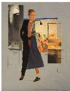
Collage (travesti) , 1980

Collagea eta arkatza kartoi mehean Collage y lápiz sobre cartulina