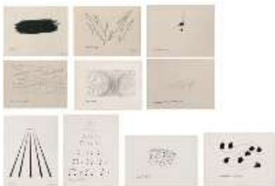
Imaginary music , 1974

Colorado, AEB | EEUU, 1939 – Paris | París, 2024