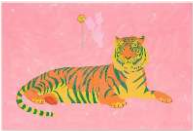
American Imperialism is... A Belleville Tiger, 2022

Parisen eta Donostian bizi da eta egiten du lan | Vive y trabaja en París y San Sebastián