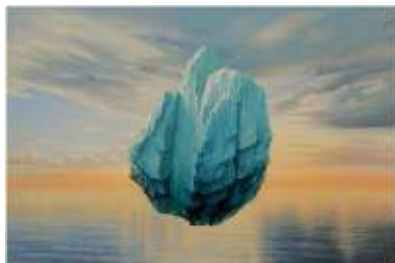
Gravitación II , 2013

Bergara, 1960 New Yorken eta Urdaibain bizi da eta egiten du lan | Vive y trabaja en Urdaibai y Nueva York