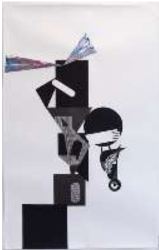
Father , 2021

Bilbon bizi da eta egiten du lan | Vive y trabaja en Bilbao