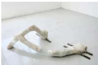
Blanco cristal, 2024

Bilbon bizi da eta egiten du lan | Vive y trabaja en Bilbao