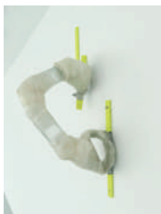
Blanco cristal, 2024

Zinta itsasgarria, beira, beira-zuntza, epoxi erretxina eta metala Cinta adhesiva, vidrio, fibra de vidrio, resina epoxi y metal