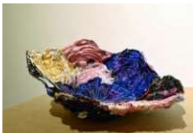
Cuenco 1 , 2012-2023

Parisen bizi da eta egiten du lan | Vive y trabaja en París