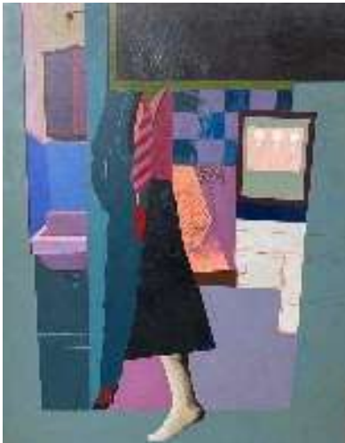
Maquillaje express para un travesti, 1980

Bilbon bizi da eta egiten du lan | Vive y trabaja en Bilbao