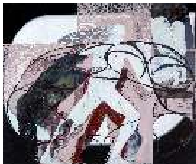
Venir al mundo , 2024

Vitoria-Gasteiz, 1994 Bilbon bizi da eta egiten du lan | Vive y trabaja en Bilbao