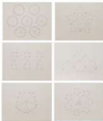
Kirkman `s Ladies , 2005