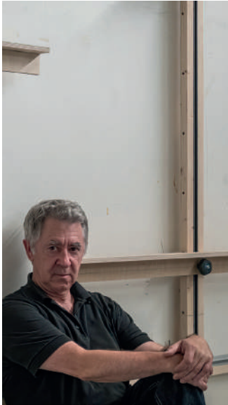
Dario Urzay Artistaren adeitasunez | Cortesía del artista