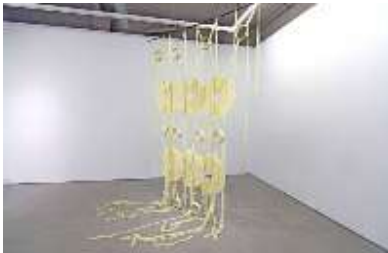
Cortina , 1994-2015

Mallorcan bizi da eta egiten du lan | Vive y trabaja en Mallorca