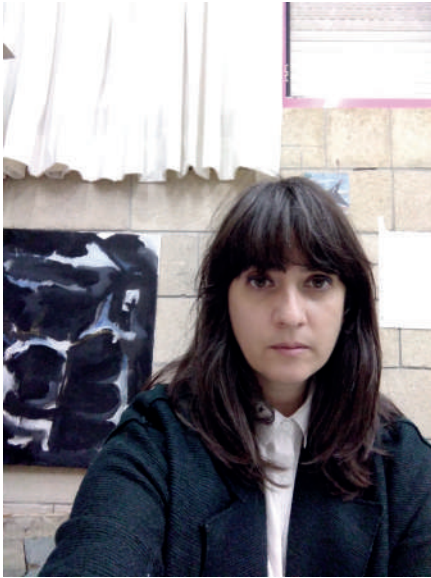
Abigail Lazkoz Artistaren adeitasunez | Cortesía de la artista