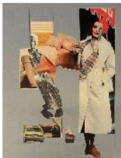
Collage (pretty) , 1980

Collagea eta arkatza kartoi mehean Collage y lápiz sobre cartulina