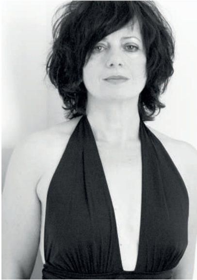
Ana Laura Aláez