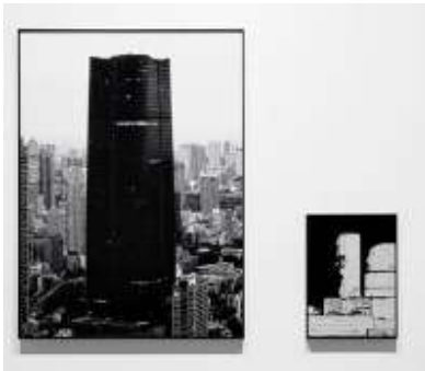
Elogio del afuera (Tokio Atenas), 2022-2023

Osloon bizi da eta egiten du lan | Vive y trabaja en Oslo