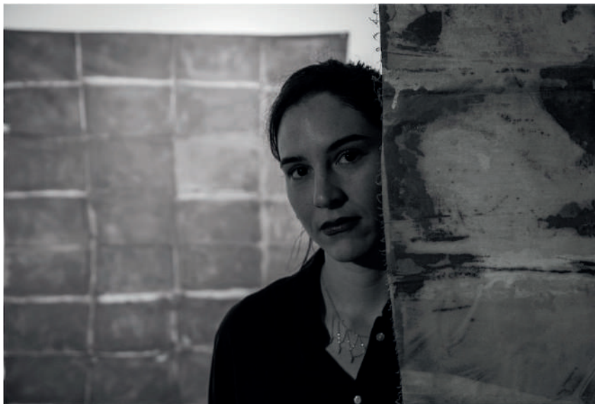
Claudia Rebeca Lorenzo