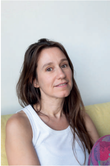
Alex Reynolds Artistaren adeitasunez | Cortesía de la artista