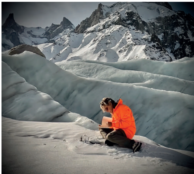
Jesus Mari Lazkano Artistaren adeitasunez | Cortesía del artista