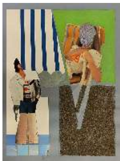
Collage (voyeur) , 1980

Collagea, gouachea eta harea kartoi mehean Collage, gouache y arena sobre cartulina