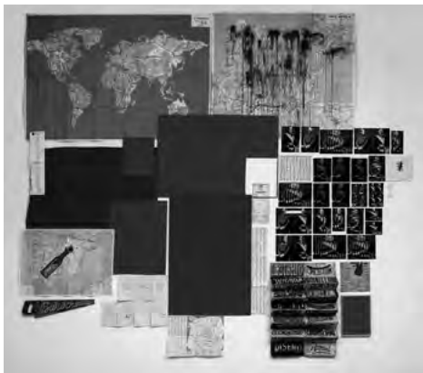
Laboratorio en transición, 2020-2021(1950-2000)