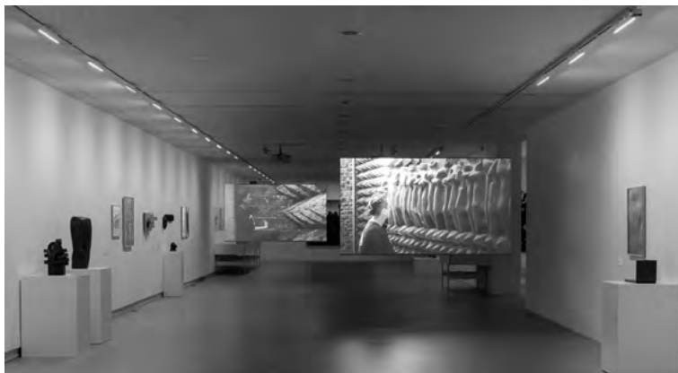
Bilduma Hau Colección. Oinarrizko mugimenduak (1950-2000) erakusketaren ikuspegia