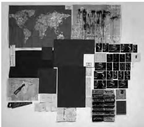
Laboratorio en transición, 2020-2021(1950-2000)