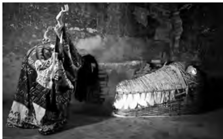
Soneto de alimañas , 2022.

El programa de la Sala Z (zinema) del Museo de Arte Contemporáneo del País Vasco se consolida como un espacio para explorar la imagen en movimiento a través de obras que se sitúan entre la práctica cinematográfica y el arte contemporáneo. En él se dan a conocer a autores y autoras que buscan nuevas formas narrativas, cuestionando las convenciones, los géneros y las categorizaciones que históricamente han definido el lenguaje cinematográfico.