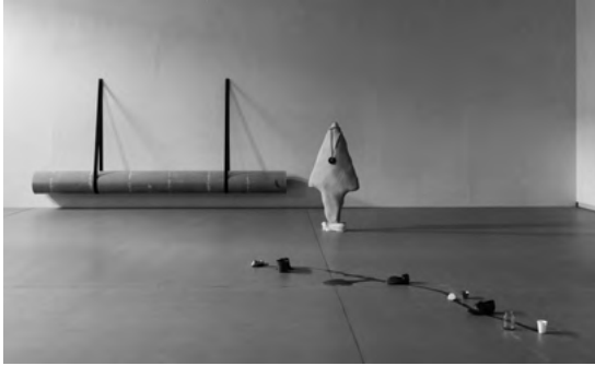
Vista de la exposición Persona, foto, copia , de Julia Spínola