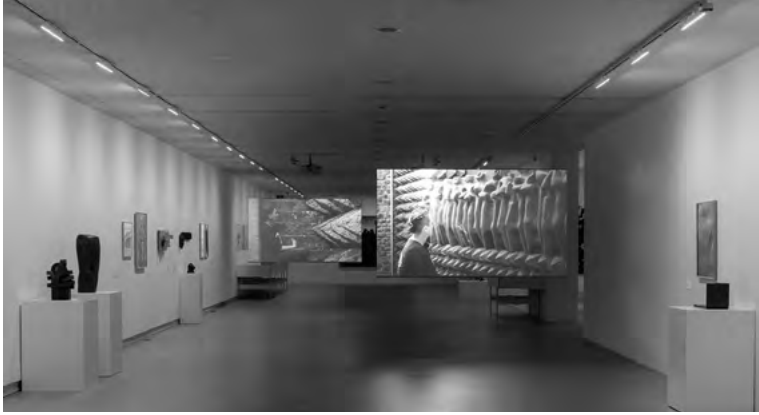
Vista de la exposición Bilduma Hau Colección. Movimientos elementales (1950-2000)