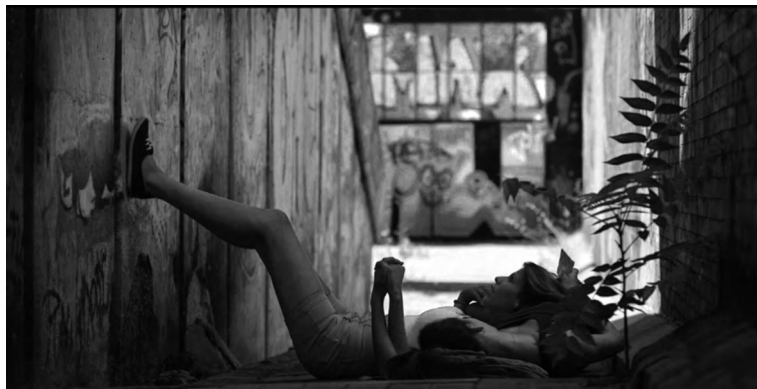
Carmen y Lola. Aratxa Echevarría, 2018