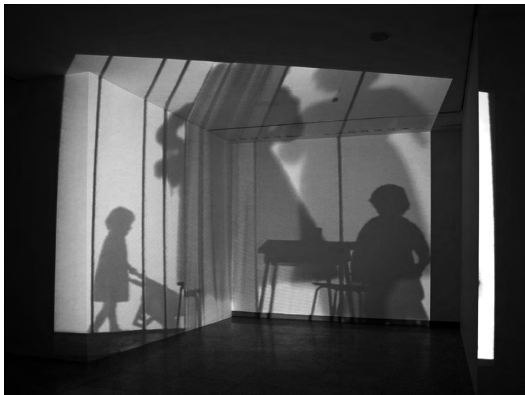
Habitación , 1996. Eulàlia Valldosera

La colección de Artium Museoa constituye un excepcional fondo patrimonial contemporáneo de carácter público integrado en estos momentos por 2.713 obras de arte. El corpus de estos fondos incide fundamentalmente en producciones realizadas desde los años cincuenta hasta la actualidad. La singularidad de esta colección define la función del museo, en tanto que equipamiento clave para aproximarse a las prácticas artísticas desarrolladas en el contexto del País Vasco en las últimas décadas. Dotar de una adecuada visibilidad y socializar su valor patrimonial es una misión programática de la institución.