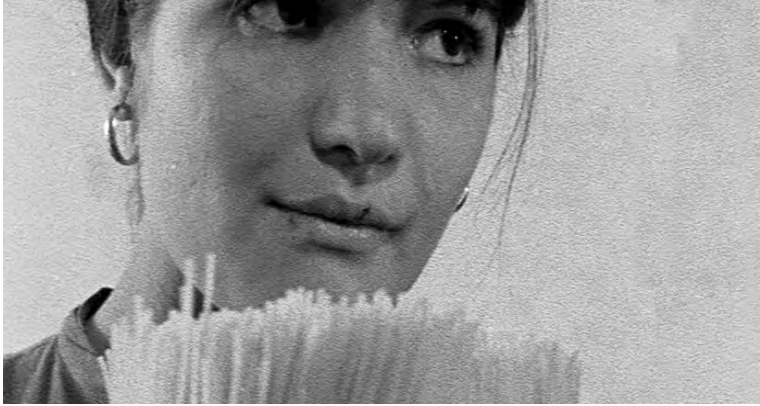
Essere donne. Cecilia Mangini, 1964