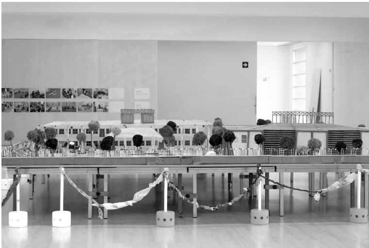
Maqueta de Barrutia Ikastola realizada por el alumnado del centro escolar

Todas las actividades del Departamento de Educación de Artium Museoa están dirigidas a garantizar la experiencia del arte a los diferentes públicos del museo. Somos sensibles a los cambios que acontecen en el mundo, por lo que todos los programas están en constante evolución para adecuarse a las nuevas necesidades de la sociedad.