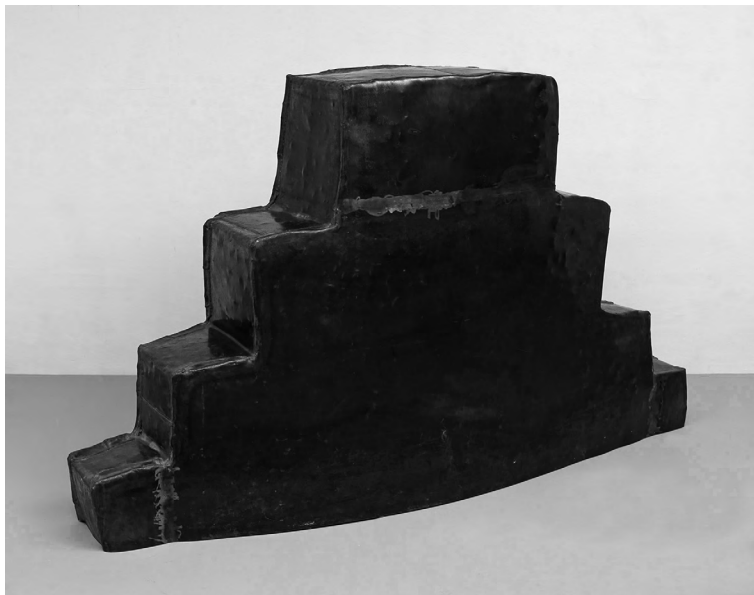
Colinas huecas n.º 3 , 1984. Susana Solano

El trabajo de Susana Solano (Barcelona, 1946) se encuentra representado en la colección de Artium Museoa desde la incorporación de Colinas huecas nº3 a los fondos de la Diputación Foral alavesa un año escaso tras su realización en 1984. Con unas dimensiones de 142 x 60 x 245 cm, sus volúmenes rotundos y la utilización de planchas de metal de acabado industrial nos remiten a propuestas próximas al minimalismo. Sin embargo, la artista catalana deja visibles los signos del proceso constructivo —los cordones de soldadura, la huella de las herramientas, el martilleado, los cambios de color producidos por el calor— dotando a la pieza de piel, de un relato que, junto al espacio sugerido de su interior, nos remite al cuerpo y a las pasiones, a la arquitectura y el paisaje, a su relación con el mundo.