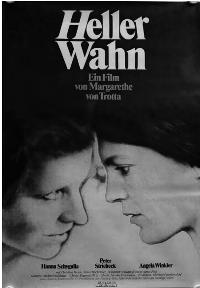
Heller Wahn (Sheer Madness). Margarethe von Trotta, 1983