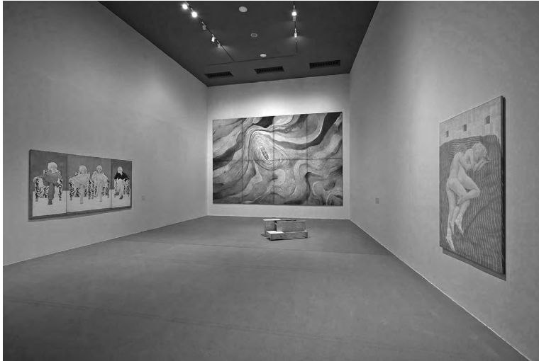
Sala A0. Artium Museoa