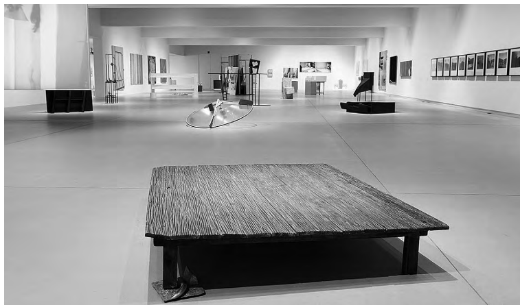
Sala A0. Artium Museoa