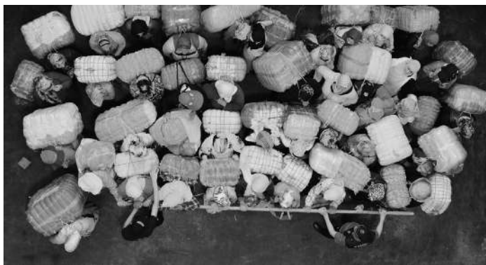
Randa Maroufi. Bab Sebta , 2019. Fotograma

El programa de la Sala Z (zinema) se consolida como un espacio para explorar la imagen en movimiento a través de obras que se sitúan entre la práctica cinematográfica y el arte contemporáneo. En él se dan a conocer a autores y autoras que buscan nuevas formas narrativas, cuestionando las convenciones, los géneros y las categorizaciones que históricamente han definido el lenguaje cinematográfico.