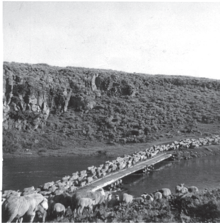
Who do you think you are? , 2014 (zatia/ detalle)

que la artista, tras elaborar un listado de las apariciones de Alfred Hitchcock en sus películas, convierte los cameos del cineasta en texto, un texto que la artista dibuja sobre papel en dos idiomas, inglés y español, y en dos colores, rojo y negro. La frase del título describe la aparición de Hitchcock en la película The Lodger: A Story of the London Fog (1927), una historia sobre un asesino en serie de mujeres inspirada en Jack el destripador, y que en español se tradujo, nada más y nada menos, como El enemigo de las rubias . Un título profético si tenemos