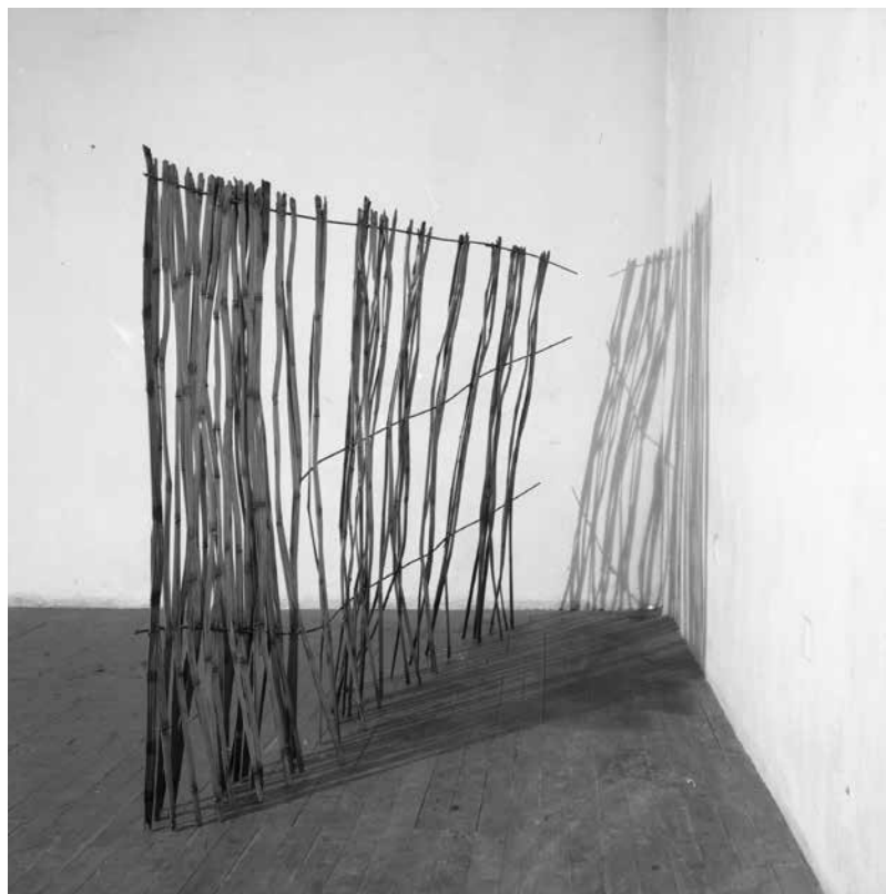
Izenik gabe / Sin título, (Valla), 1986

latu kontzeptual eta postminimalistak eta Euskal Herriko eskulturaren lengoaien herentzia alderatzen dira. Postmodernitatearekiko topaketa horretan, artistak lan-corpus bat definituko du, materialen kontrasteak eta diskurtsoaren koherentziak baldintzatuta. Azkenik, aipatzekoa da XX. mendeko artearen historiaren ezagutza sakonak eta Euskal Herriko Arte Ederren Fakultatean eskultura-irakasle gisa —1987. urteaz geroztik irakasle da bera bertan— egindako lanak zeharkatzen dutela ekoizpen hori.