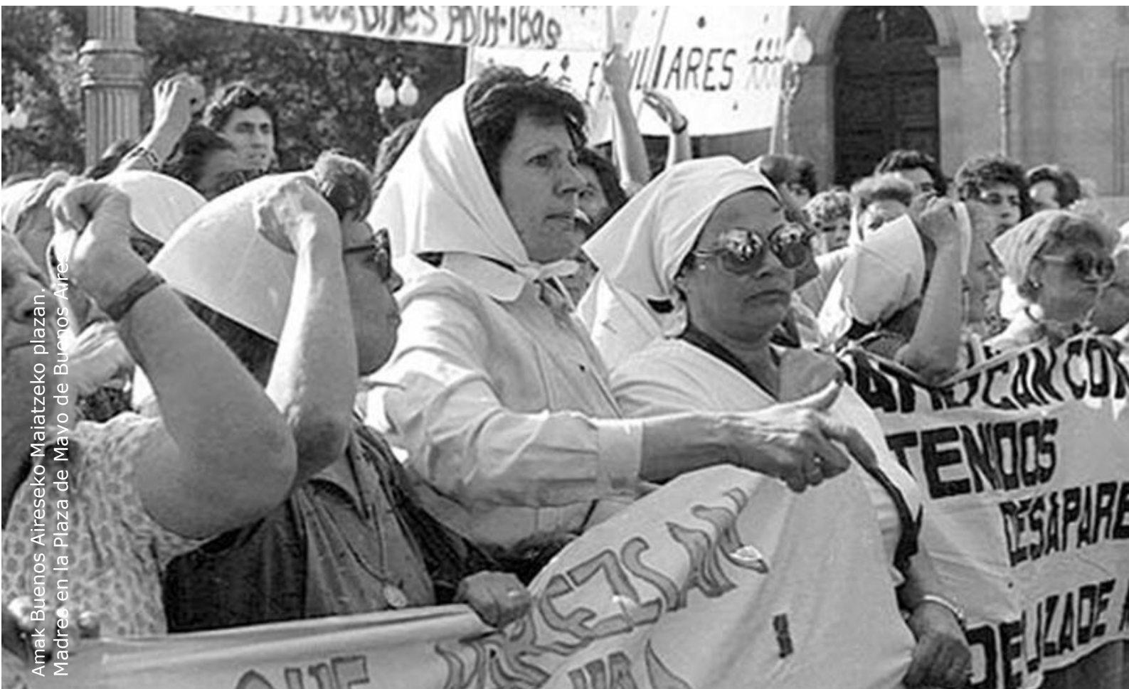
Amak Buenos Aireseko Maiatzeko plazazan. Madres en la Plaza de Mayo de Buenos Aires.

Martxoaren 19an, astelehena Lunes, 19 de marzo