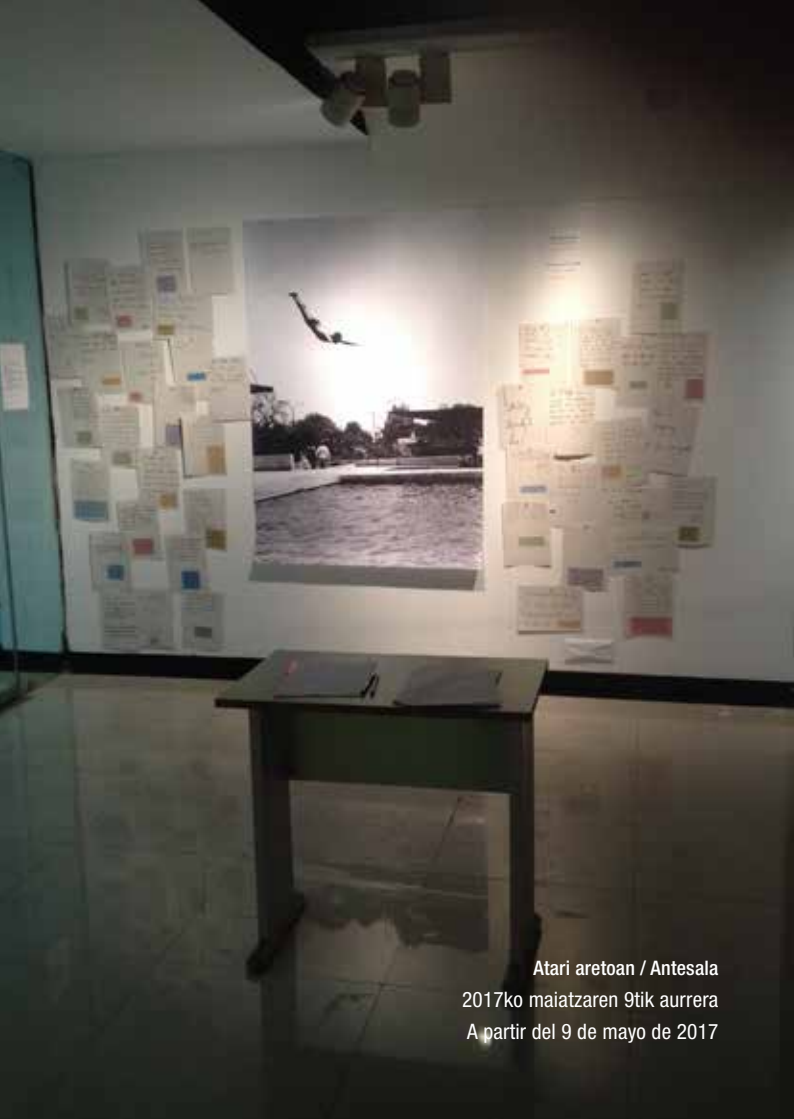
Atari aretoan / Antesala 2017ko maiatzaren 9tik aurrera A partir del 9 de mayo de 2017