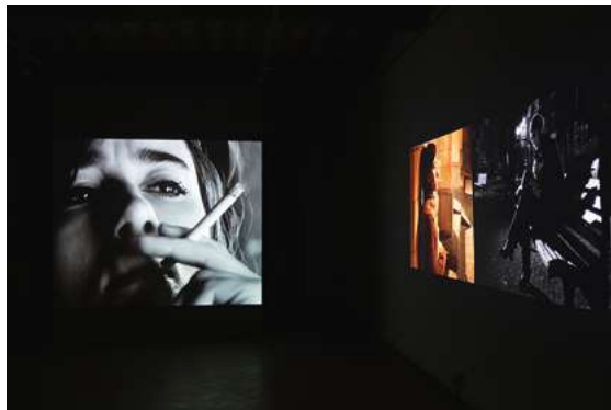
9. Instalazioaren ikuspegia, Casa Masaccio, 2022

Lehenik, artista batek proposatu zidan film bat egitea, dantzari batzuk agertzen ziren pieza baterako. Dantzariak Anbereseko kaleetan erretzen filmatzeko eskatu zidan. Zuri-beltzean egin nahi nuen, hiru pantailatan, piezarekiko harremana abstraktuagoa izan zedin.