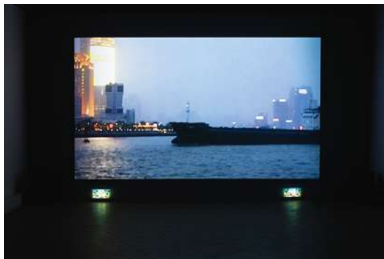
8. Instalazioaren ikuspegia, Casa Masaccio, 2022

Soinuak baino gehiago, irudiak baino gehiago, hierarkiarik gabe, marrazki bizidunekin batera agertzen da Mona Lisa, eta Chopin, berriz, 1970-1980 hamarraldietako musika estatubatuarrekin nahasian dago, halako plazer anbiguo batean.