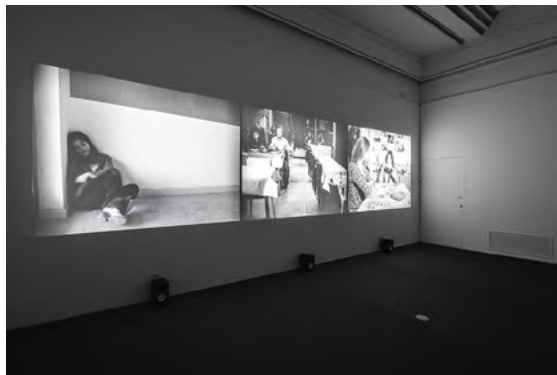
14-15. Instalazioaren ikuspegiak, La Virreina, Bartzelona, 2023-2024 (ezkerrean), Galerie Marian Goodman, Paris, 2021 (eskuinean)

Filma hiru denboraren ganean eraikita dago: bizitako egoerei dagokien denboretan, hain zuzen. Alde batera utzita erreportajearen denbora, haren [il] denbora, badago, batetik, niaren denbora, denetan fantasiazkoena, kanpokoarekin lotuta ez dagoena, eta, bestetik, emakumearen denbora [elle], hau da, alderdi psikologikoarena: horko horretan, beren bideak gurutzatzen direlarik bi pertsonaren artean gertatzen denak baldintzatzen du denbora.