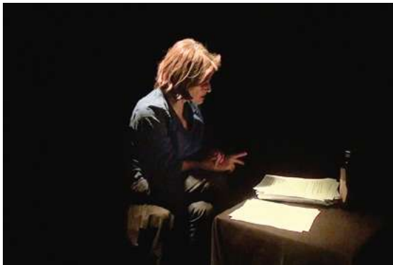
16. Instalazioaren fotograma