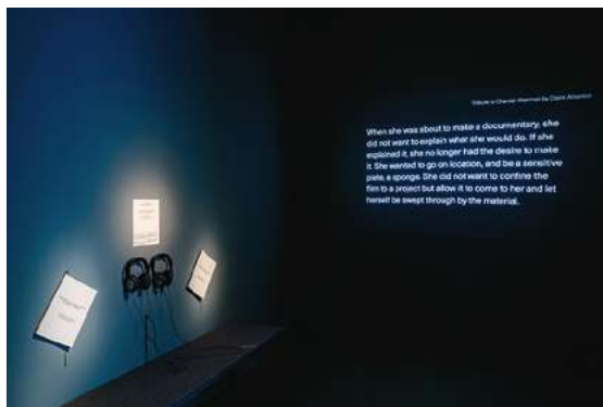
21. Instalazioaren kokapena, La Virreina, Bartzelona, 2023-2024