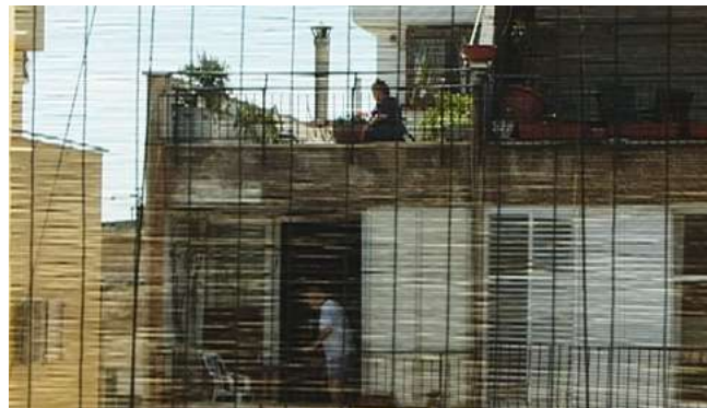
13. Là-bas, fotograma