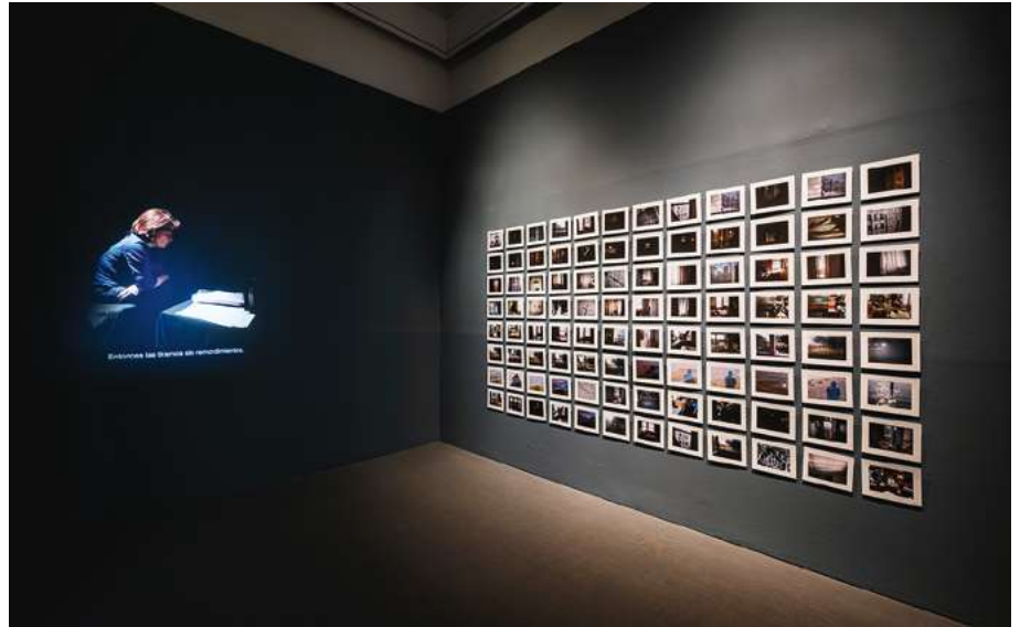
17. Instalazioaren ikuspegia, La Virreina,artzelona, 2023-2024

96 inkjet inprimaketako multzo hau Maniac Shadows (2012) instalaziorako egin zen hasiera batean. Fondation Chantal Akerman-en eta Marian Goodman Gallery-ren adeitasunez