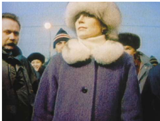
12. D'Est, au bord de la fiction instalazioaren bideo-pantaila baten argazkia