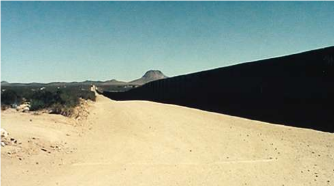
18. De l'autre côté (2002), fotograma

Hurrengo orrialdeetan: 19-20. Une voix dans le désert , instalaziorako pantailaren kokapena, Sonorako basamortua, AEBen eta Mexikoren arteko muga, 2002