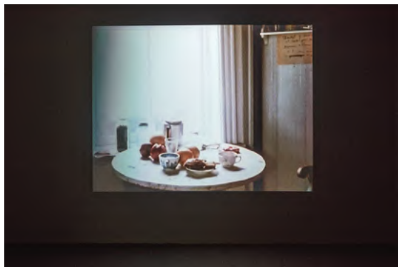
7. Instalazioaren ikuspegia, Rio Oi Futuro, 2018

La Chambre zera esperimentala da guztiz; Hotel Monterey filmatzen amaitu eta biharamunean grabatu nuen. Kamerak grabaketa-mugimendu bat eta bera egiten du zenbait aldiz, eta, halako batean, kontrako norantzan jotzen du. Harridura eragiten du ikuslearen garunean, hautsi egiten baita hark aldaezintzat jotzen zuen erritmoa.