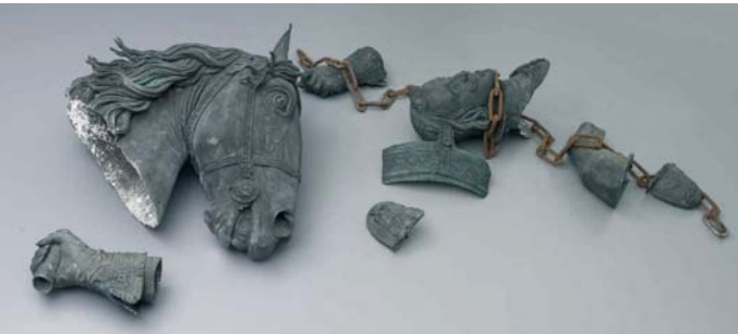
Fernando Sánchez Castillo Perspectiva ciudadana (Serie Notas para la educación estética de la burguesía serie) 2004

Fieles al compromiso de incrementar cada año los fondos del museo para configurar una colección sólida que atestigüe de manera fiel y rigurosa la evolución de la creación artística contemporánea, ARTIUM presenta la tercera versión de la exposición Adquisiciones recientes . Para esta cita, se ha llevado a cabo una selección de entre las 835 obras ingresadas en el museo entre los años 2004 y 2006, que han pasado a formar parte de la colección mediante depósitos (Saénz de Tejada, Arco, etc) compras y donaciones.