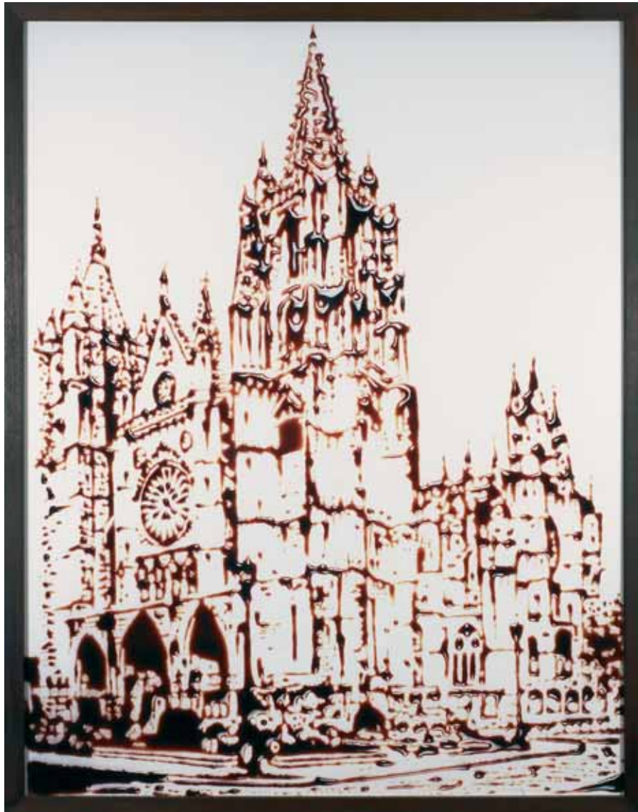
VIK MUNIZ, Cathedral Leon (serie Pictures of Chocolate seriea (Cathedrals)), 2003

Komisarioa / Comisariado: Daniel Castillejo